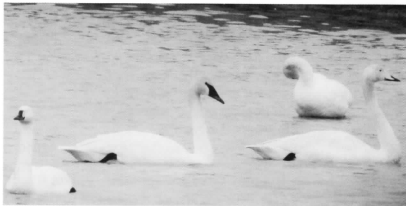
ナキハクチョウ 剣淵川右岸遊水池

最初にナキハクチョウを発見したとき、双眼鏡では「あっ、アメリカコハクチョウかな?」と思い、望遠鏡でよくよく確認してみると、それはなんとナキハクチョウだったので。マガン中のカリガネを見つけるように辛抱すれば見つけることができるとは思っていました。以前にバンクーバーではナキハクチョウの群れの中に亜種アメリカコハクチョウを1羽見つけたことがあります。マ