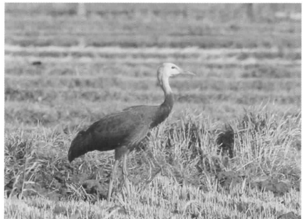
ナベヅル 2009.11.24

ナベヅルの飛来は、地元の観察者によると余市町では1996年4月以来13年振りの記録ということですが、実は1996年4月には道南、道央などに多数飛来したことが新聞記事として残されています(北海道新聞1996/5/2)。