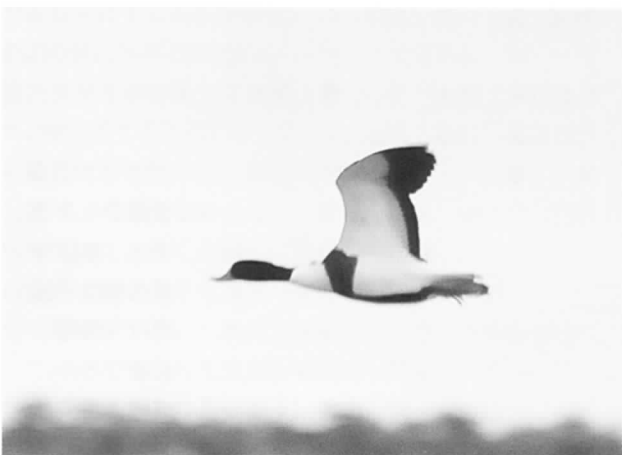
ツクシガモ 2009.11.29