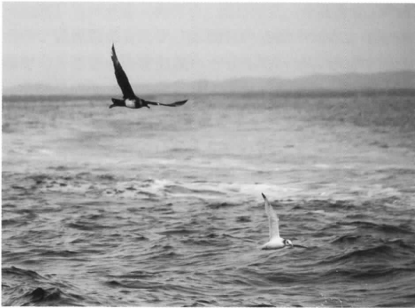
ミツユビカモメを襲うトウゾクカモメ

普段は、4時間のチャーターで、鵜川沿岸まで行き、そして沖に回って帰るといったコースをとっています。