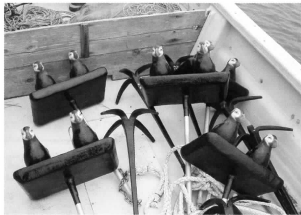
海上に置くエトピリカのデコイ

い、この度NPO法人エトピリカ基金を仲間と立ち上げました。海鳥の現状を調査し、問題点を把握し、保護に結び付けていくことを目的としています。こうした活動を続けていくには多くの方々の応援が必要です。サポート会員などを募集していますが、まずは私たちの活動を知っていただきたいと思っています。ネットをご利用できる方はぜひホームページをご覧ください。ネットを見られない方は簡単なパンフレットを送付いたしますのでご請求いただければと願っています。