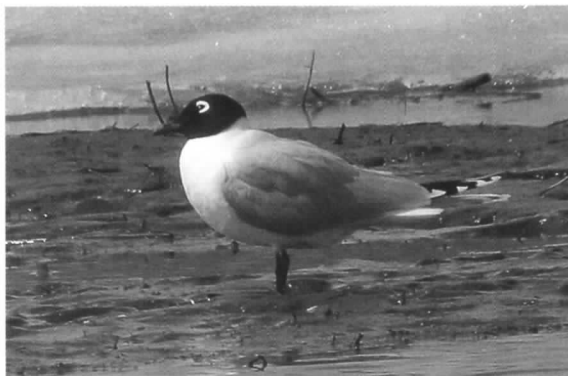
2010.4.4 千歳市長都沼

のは、豊頃湧洞沼(1976.10.28)、浜頓別(1979.10.7)、根室西別川河口(1998.5.20)、鶴川河口(1998.5.10.16)、石狩市八幡(2003.5.20)の5例で、今回が6例目となります。