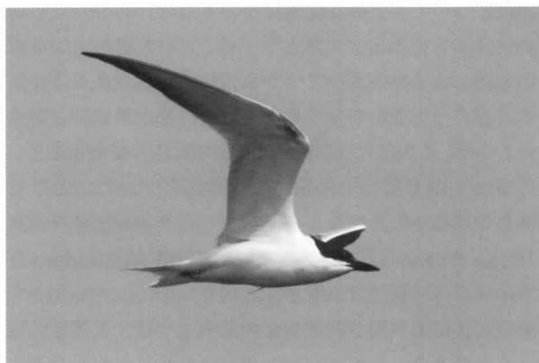
2009年6月23日 天塩町鏡沼

最近、札幌にいる北海道野鳥愛護会の知人にその話をして調べてもらうと、道内では初記録で日本全体でもかなり珍しいとのことでした。予想外でしたのでご一報させてい