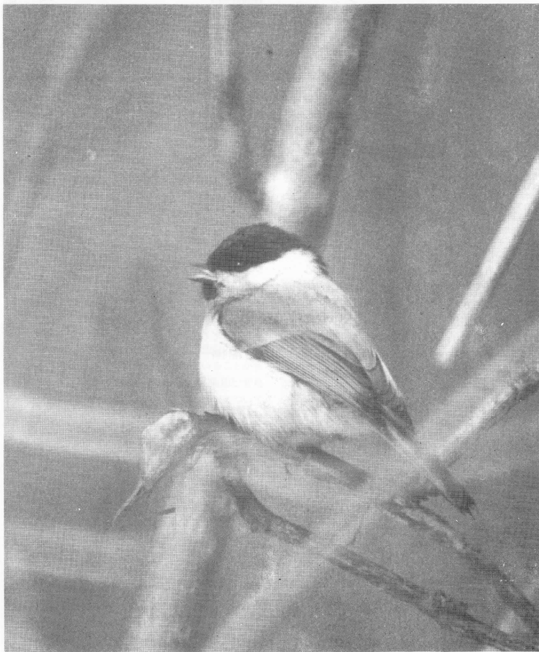
ハシブトガラ 野幌森林公園